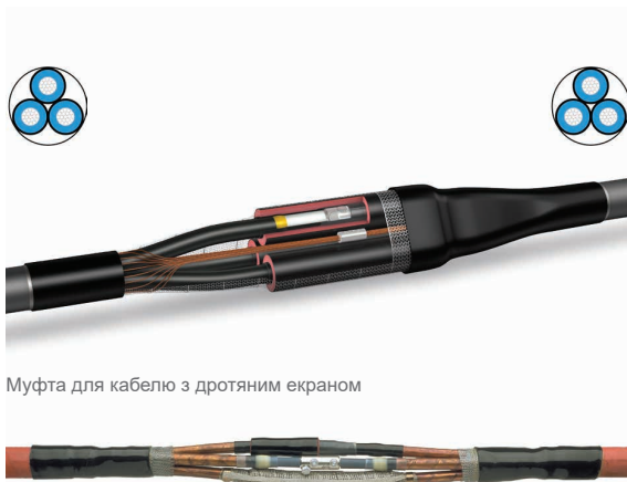
Муфта для кабелю з дротяним екраном

Комплект дає можливість використання з'єднувальної муфти для кабелів з алюмінієвим екраном.