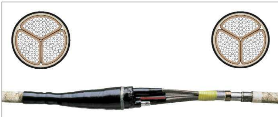
Кабель с общим экраном