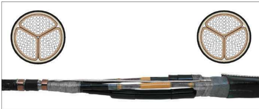
Кабель с экраном для каждой жилы