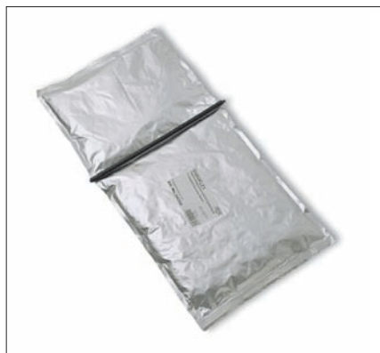
2-компонентный Guroflex в двухкамерном пакете