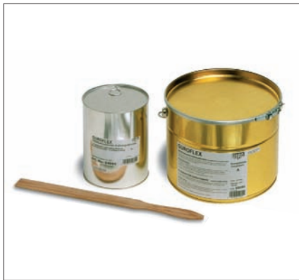
2-компонентный Guroflex в банках