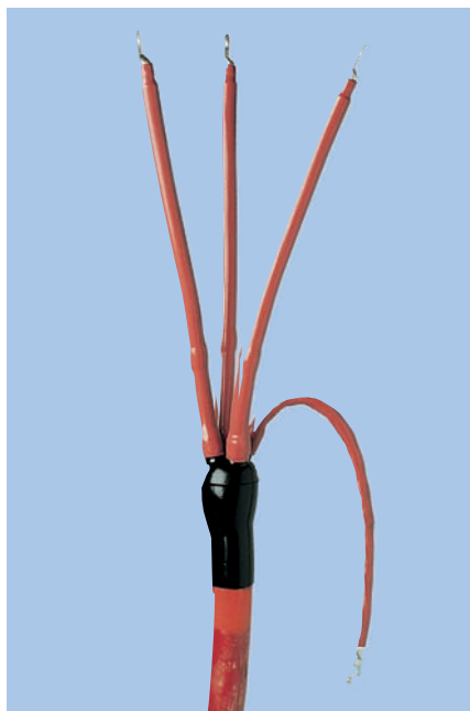
Концевые муфты внутренней установки